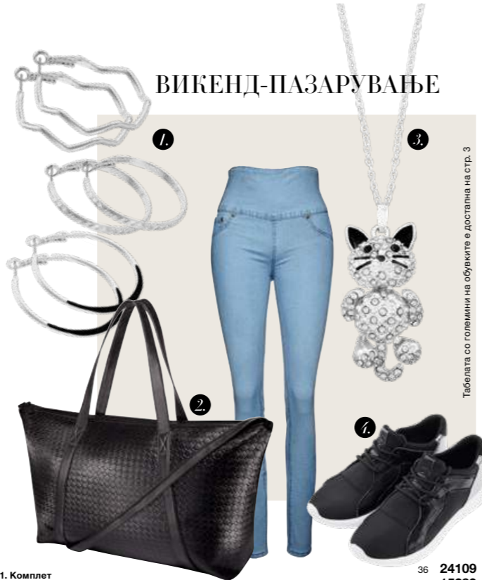
Табелата со големини на обувките е достапна на стр. 3