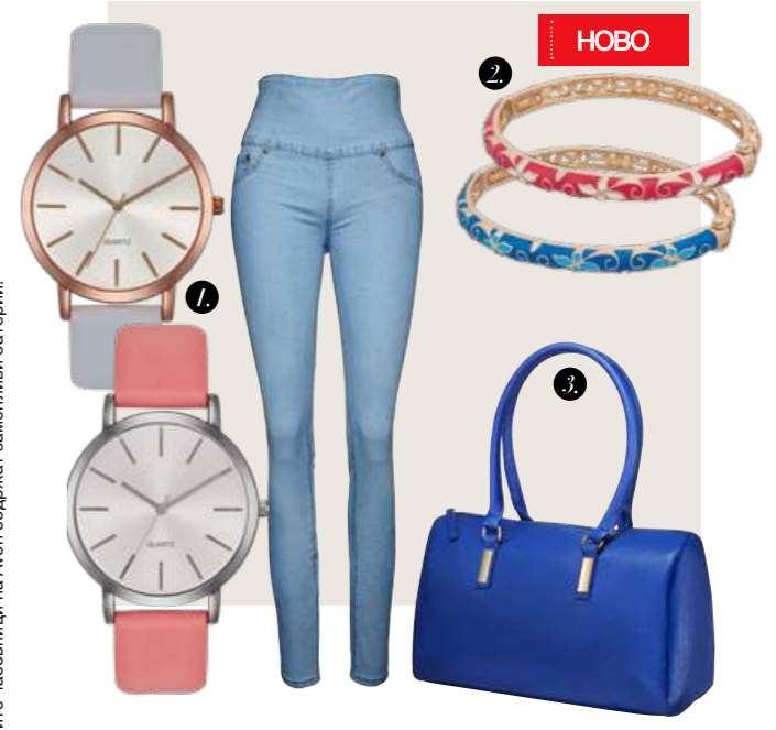
Сите часовници на Avon содржат заменливи батерии.