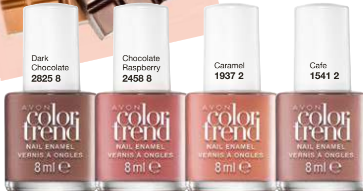
Dark Chocolate 2825 8