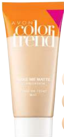
Матирачка пудра Make Me Matte 30 мл 300 ден.