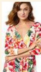
со цветен принт

4550 0 S 2374 7 M 4720 9 L 4566 6 XL 4520 3 XXL