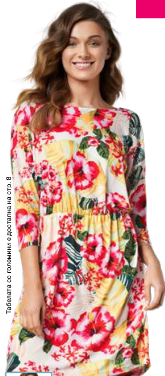
Табелата со големини е достапна на стр. 8