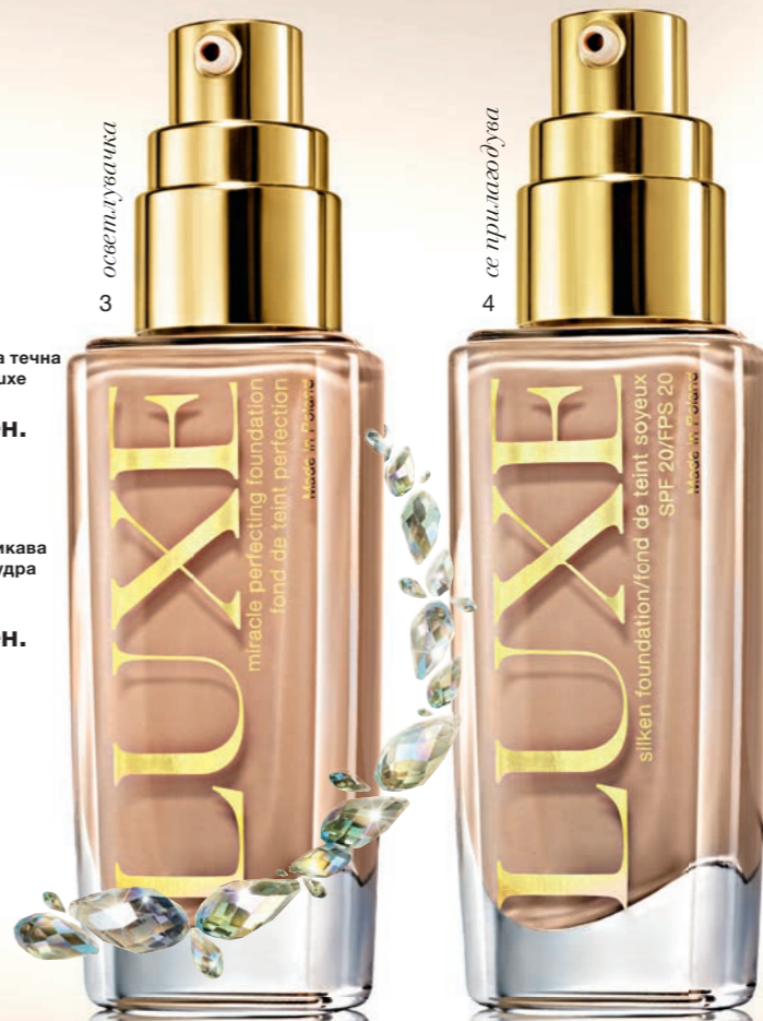
4. Свиленава течна пудра LUXE 30 мл 800 ден.