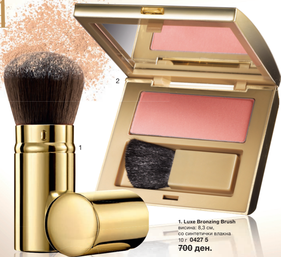
1. Luxe Bronzing Brush висина: 8,3 см, со синтетички влакна 10 г 0427 5 700 ден.